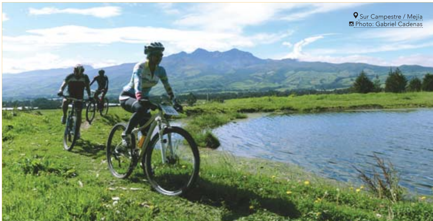
📍 Sur Campestre / Mejía