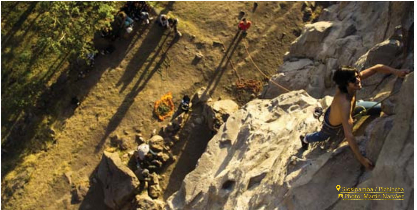
Sigsipamba / Pichincha