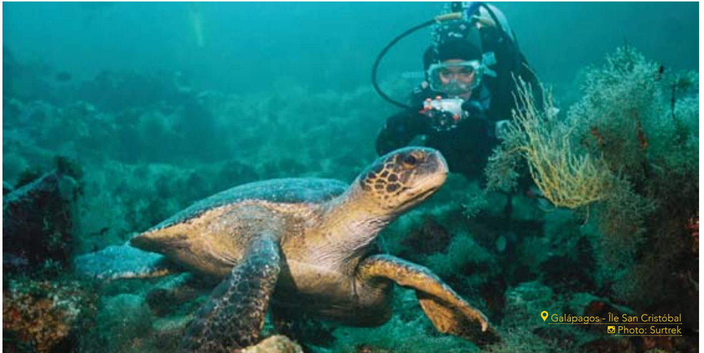
Galápagos - Île San Cristóbal