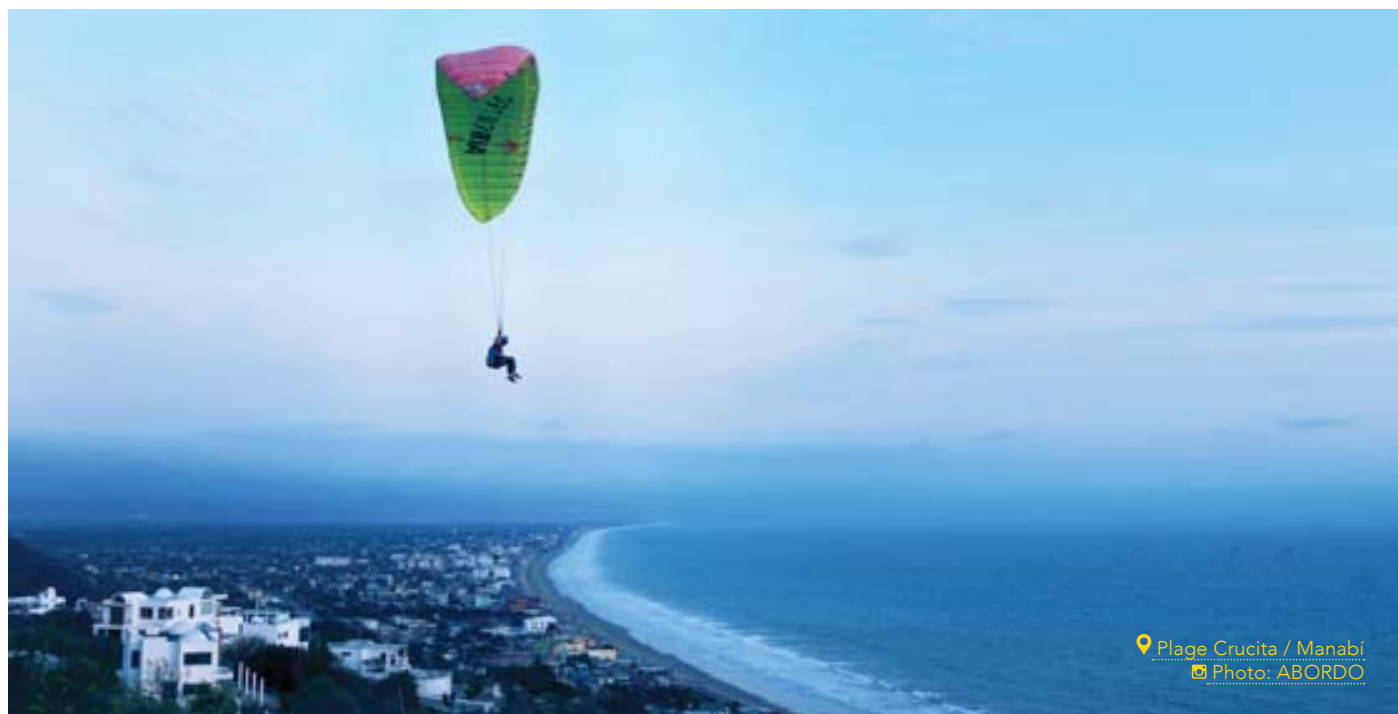
📍 Plage Crucita / Manabí